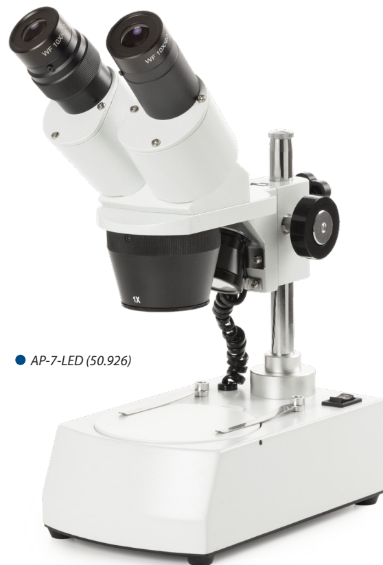
● AP-7-LED (50.926)