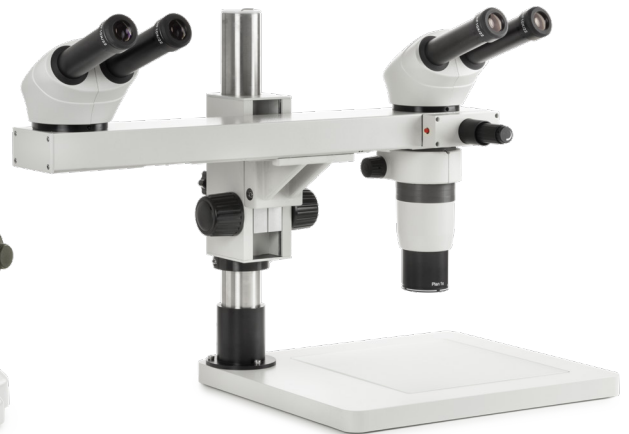
● Kundenspezifische Fluoreszenz Konfigurationsmodell