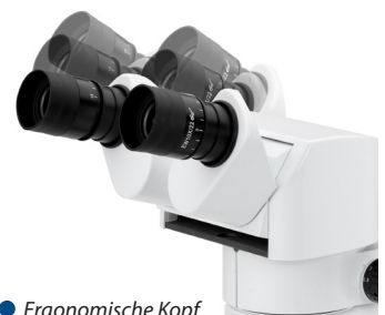
• Ergonomische Kopf